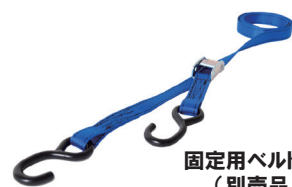
固定用ベルト (別売品)