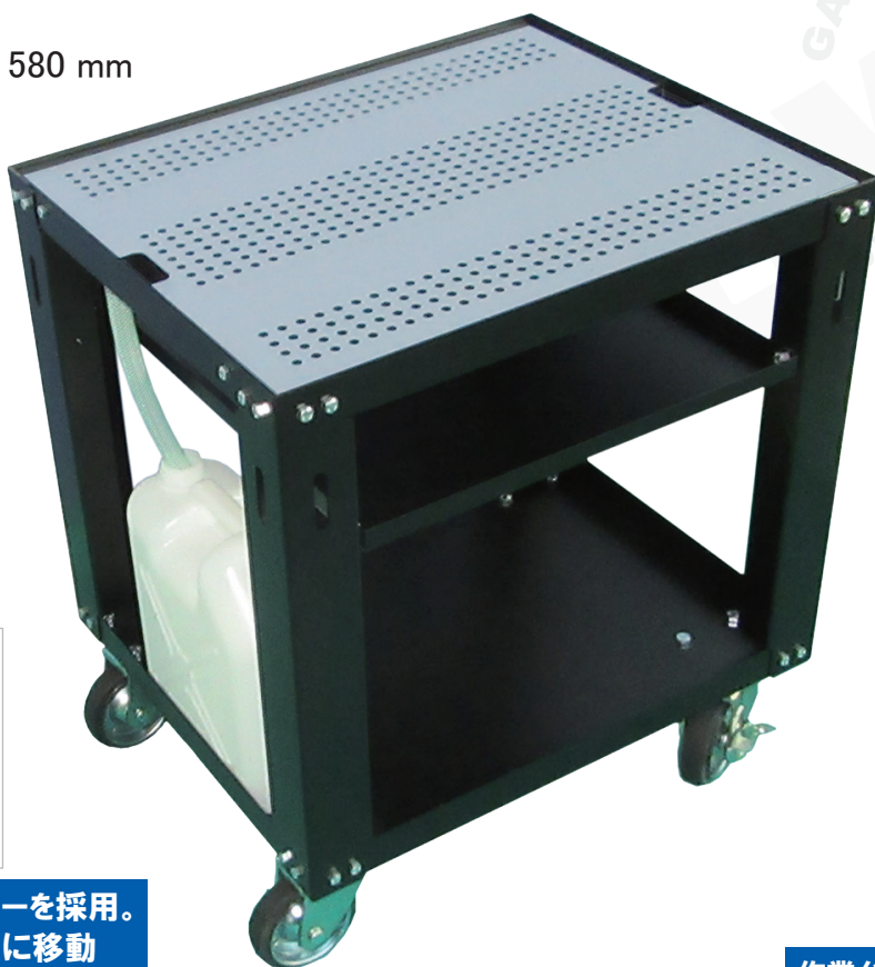
ポリタンク (標準付属品)

台板寸法：700 mm × 580 mm 全高：800 mm 許容荷重：約 200 kg