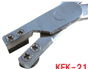
KFK-21-13 ブレーキピストンプライヤー 薄型 16 ~ 26mm