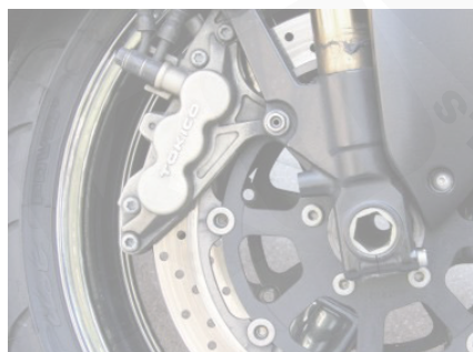
2輪車のブレーキキャリパー (画像はイメージです)