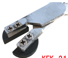
KFK-21-14 ブレーキピストンプライヤー 薄型 26 ~ 36mm